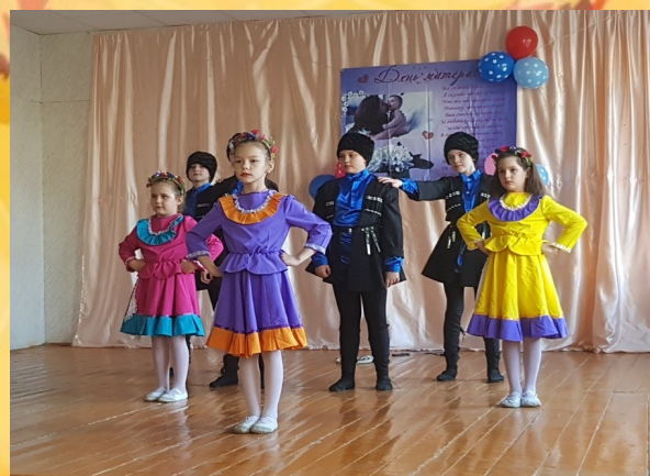
Танцевальный коллектив «Элегия»