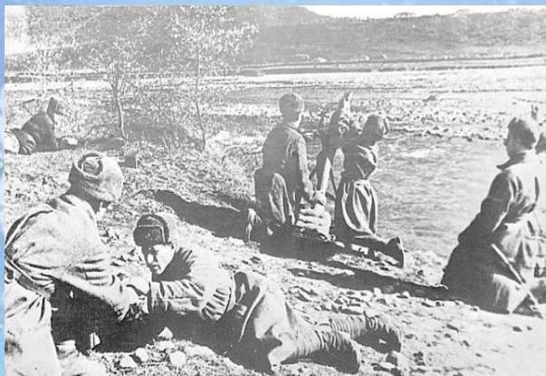
Оборона города-курорта Железноводска

В честь этого события в нашей школе прошли Уроки Памяти, Уроки Мужества. Многие классные руководители провели классные часы об освобождении Кавказа.