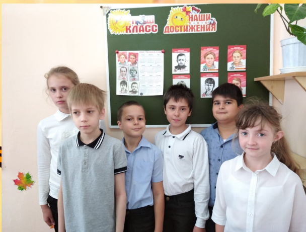
Ученики 3 А класса