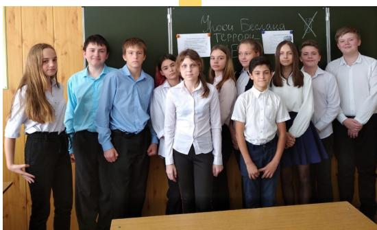
Классный час в 7 А классе