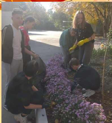
8 А класс на субботнике

Всем ребятам, кто внес свой вклад в уборку, огромное спасибо.