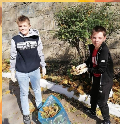
6 А класс на субботнике