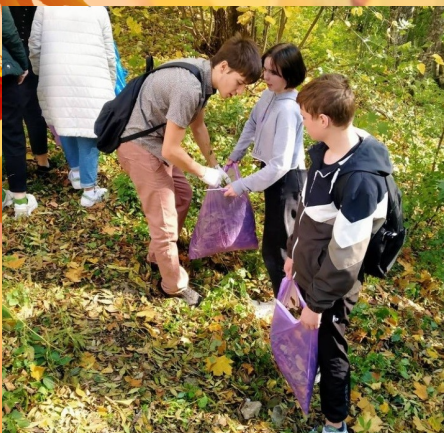
9 Б класс на субботнике