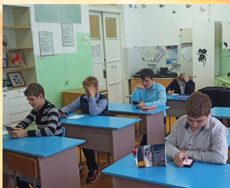
Школьный этап ВсОШ на платформе «Сириус»

Это ли не лучший подарок учителям в канун их профессионального праздника!