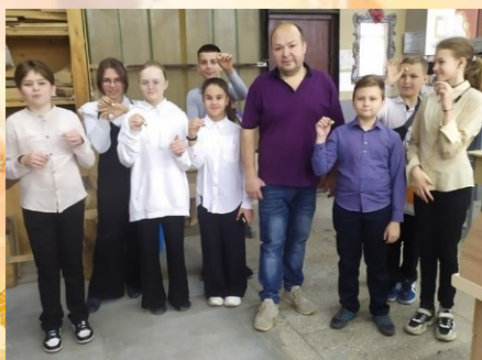
Обучающиеся 6б и преподаватель ЖХСТ

Подготовка подрастающего поколения к созидательному труду на благо общества — важнейшая задача всей образовательной системы государства. Ее успешное осуществление связано с постоянным поиском наиболее совершенных путей трудового воспитания и профессиональной ориентации.